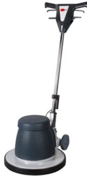
Die Abbildung repräsentieren nicht das Modell

Einfach und leicht zu bedienen Leicht zu bewegen Ergonomischer Handgriff Schönes Design Sicherheitsschalter Komplett und einsatzbereit VIPER VE 18 P ist eine leistungsstarke Low-Speed Einscheibenmaschine, konzipiert für verschiedenste Reinigungsaufgaben. Durch das Plattformdesign können wir die VE Maschinen zu einem attraktiven Preis-Leistungs-Verhältnis anbieten. Sie sind einfach und leicht zu bedienen.